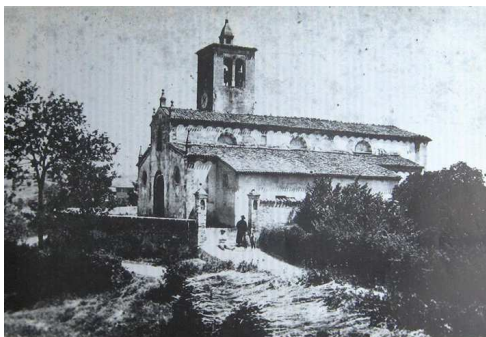
LA PIEVE DI S.VALENTINO IN UNA FOTO ANTICA